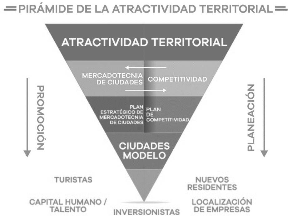
Gráfico 1. Pirámide de la atraktividad territorial de las ciudades