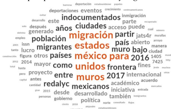
Figura 4. Esquema de conceptos para el artículo Muros y migración México-Estados Unidos .

Nota: Figura basada en el artículo de Arroyo y Rodríguez (2018), (Elaboración propia de los autores).