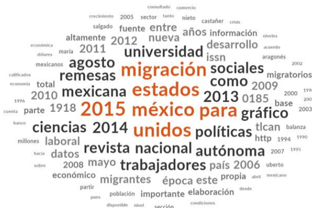
Figura 3. Esquema de conceptos para el artículo Migración laboral México-Estados Unidos a veinte años del Tratado de Libre Comercio de América del Norte .

Nota: Figura basada en el artículo de Aragonés y Salgado (2015), (Elaboración propia de los autores).