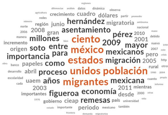
Figura 8. Esquema de conceptos para el artículo El proceso de asentamiento de la migración México-Estados Unidos .

Nota: Figura basada en el artículo de Figueroa y Pérez (2011), (Elaboración propia de los autores).