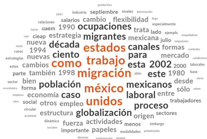
Figura 6. Esquema de conceptos para el artículo Migración y trabajo en la era de la globalización: el caso de la migración México-Estados Unidos en la década de 1990 .

Nota: Figura basada en el artículo de Canales (2002), (Elaboración propia de los autores).