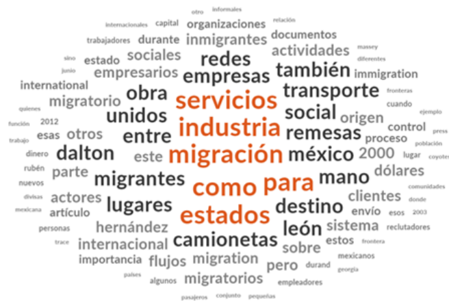
Figura 9. Esquema de conceptos para el artículo La industria de la migración en el sistema migratorio México-Estados Unidos .

Nota: Figura basada en el artículo de Hernández (2012), (Elaboración propia de los autores).