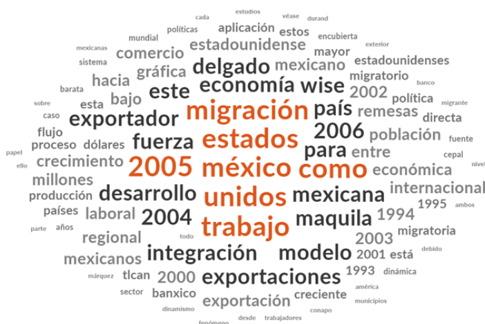
Figura 7. Esquema de conceptos para el artículo La migración mexicana hacia Estados Unidos a la luz de la integración económica regional: nuevo dinamismo y paradojas .

Nota: Figura basada en el artículo de Delgado (2006), (Elaboración propia de los autores).