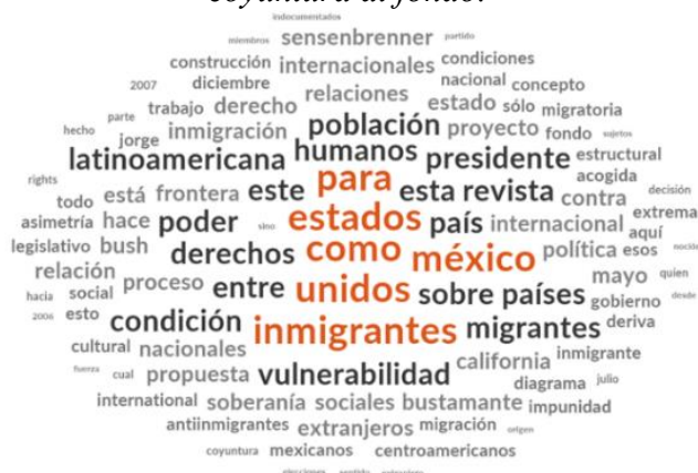
Figura 5. Esquema de conceptos para el artículo La Migración de México a Estados Unidos: de la coyuntura al fondo .

Nota: Figura basada en el artículo de Bustamante (2007), (Elaboración propia de los autores).