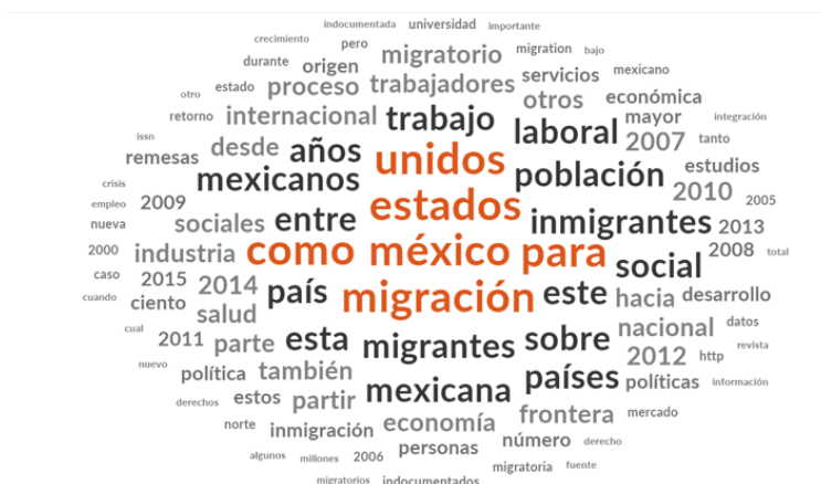
Figura 2. Esquema global de conceptos

Nota: La imagen muestra los conceptos de mayor frecuencia de los artículos someridos al software NVivo (elaboración propia de los autores).