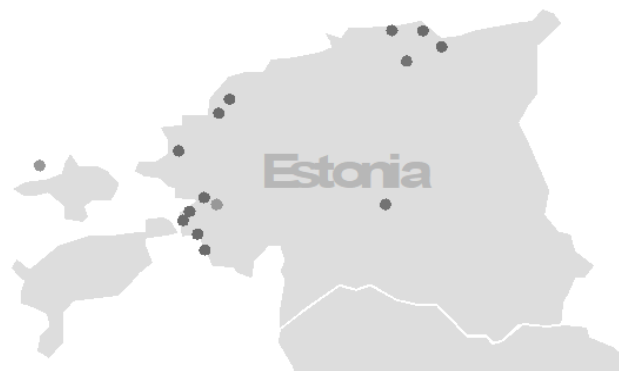
Figura 3. Energía eólica en Estonia: Granjas eólicas funcionando en el país.